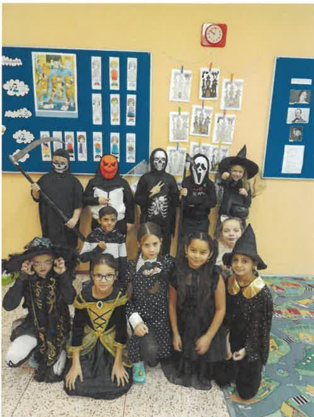
Přehled soutěží, akcí a projektových dnů 2024/2025